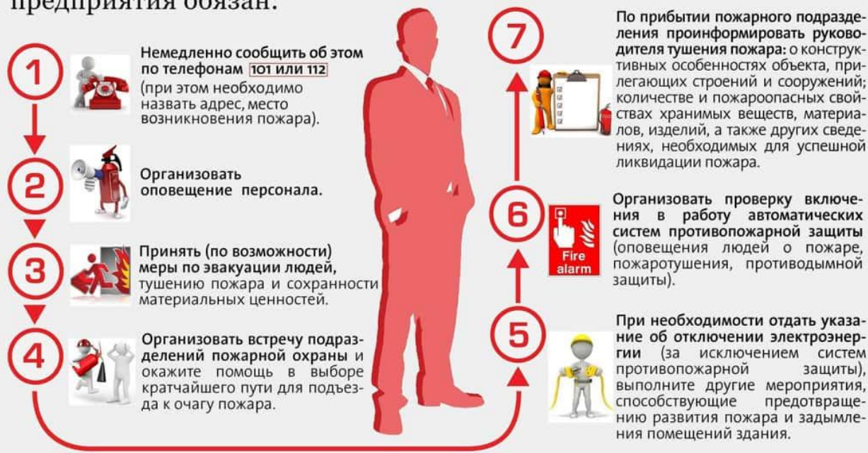
Действия руководителя объекта при пожаре

В случае возникновения возгорания или пожара, руководитель предприятия обязан: